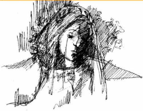
Purgatorio XXX canto-Beatrice

I principali "tipi" costituzionali, in omeopatia, sono il carbonico , il fosforico , il sulfurico e il fluorico .